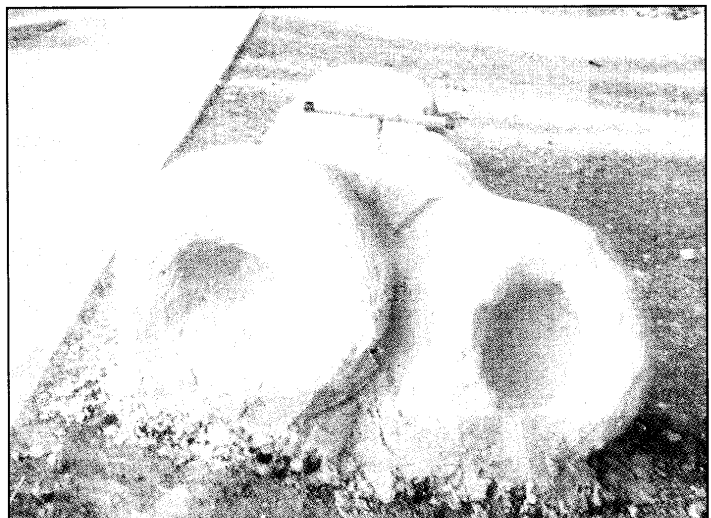
ספסלים ממוחזרים. בעמק הירדן

נערי עמק הירדן בונים ספסלים מחומרי פסולת על "טיילת הראשונים", בין צמח לאשדות-יעקב, והכנו ספסלים מחו" מרי פסולת. לפני כשנה עשו זאת כיתות ז' ו-ח' בין בית-זרע לצמח. השנה, במהלך חודש אוגוסט החם, עמלו קבוצת בני הנעורים מיישובי המועצה (המייחסת חשיבות רבה לפעילות מחזור והינוך לבריאות הציבור), במשותף עם משלחת גרמי גית המתארכת בעמק - על הכנת "ספסלי ספורט" להנאת הצועדים הרבים, הרצים והרוכבים בטיילת היפיפייה. את הרעיון יזמה מנהלת מחלקת הבריאות במועצה, עיריית פורת, והעבודה נעשתה במשותף עם "מרכז עידן" (החינוך הבלתי-פורי מאלי במועצה) ובהדרכתה המטורה - זו השנה השנייה - של האמנית אסתי חרמון. טקס הנובת הספסלים יתקיים במהלך הסתיו.